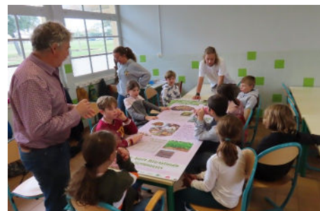
Avec les enfants du Centre Aéré

'abc 21' et la commune ont participé à la Quinzaine Européenne du Développement Durable en faisant la promotion des Légumineuses.